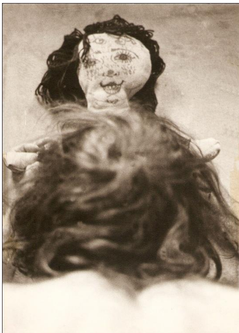
Τα φιλιά γύρω από το στήθος;